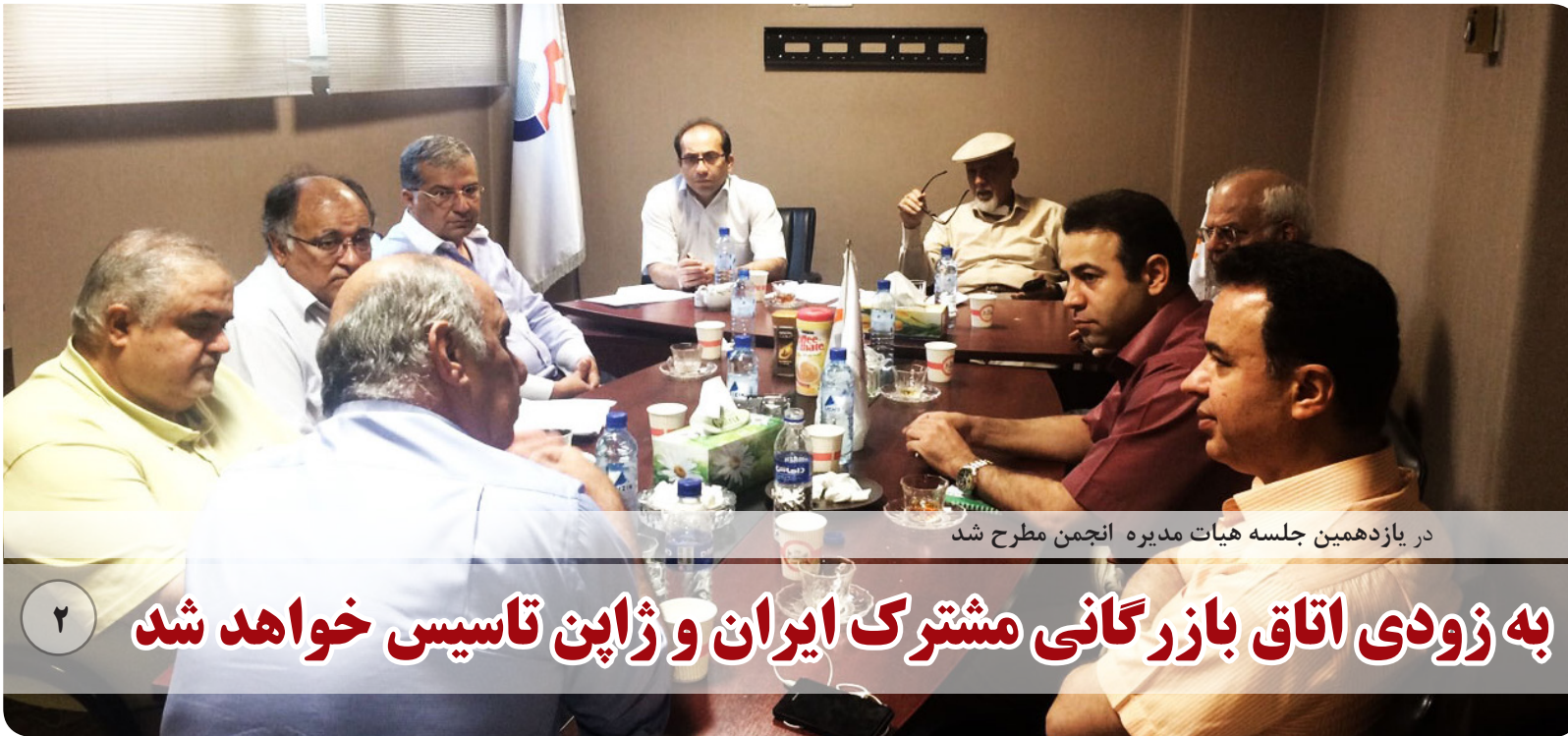
در یازدهمین جلسه هیات مدیره انجمن مطرح شد